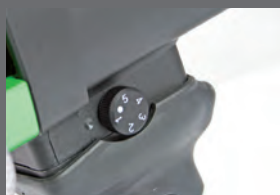
Regolazione della velocità