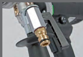
Controllo dell'approvvigionamento idrico